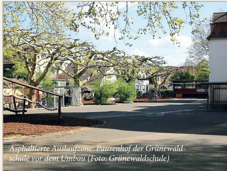
Asphaltierte Auslaufzone: Pausenhof der Grünwaldschule vor dem Umbau

Heilbronner Informations- und Pressedienst / Redaktion