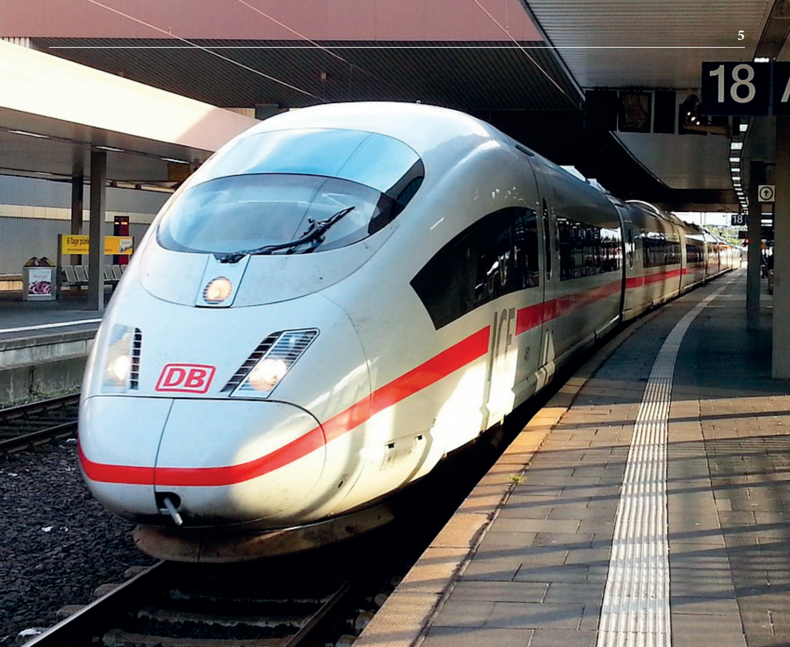
Wartender ICE: ein Anblick, den man sich für Heilbronn täglich wünscht