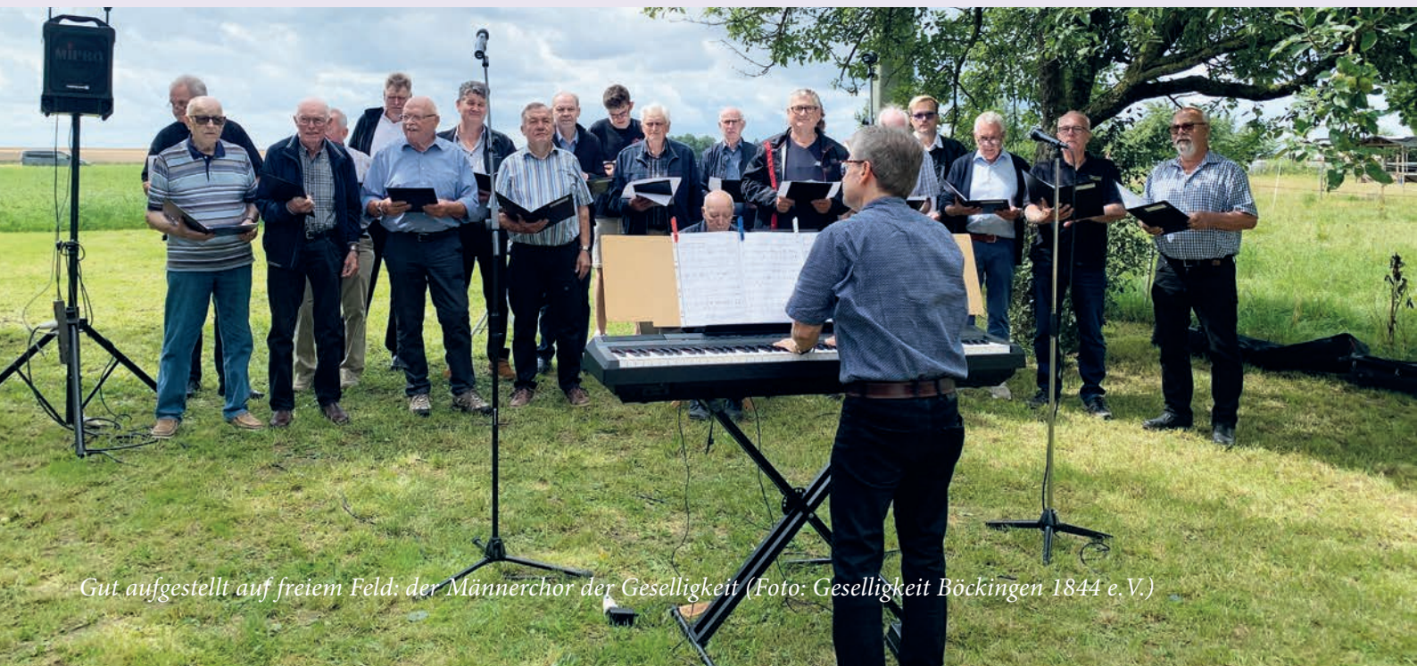
Gut aufgestellt auf freiem Feld: der Männerchor der Geselligkeit