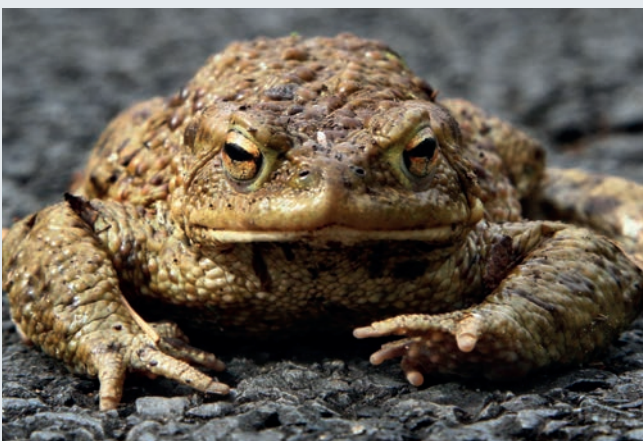
Sieht plattgefahren auch nicht schöner aus: Kröte auf Asphalt

Text: Heilbronner Info- und Pressedienst / Redaktion