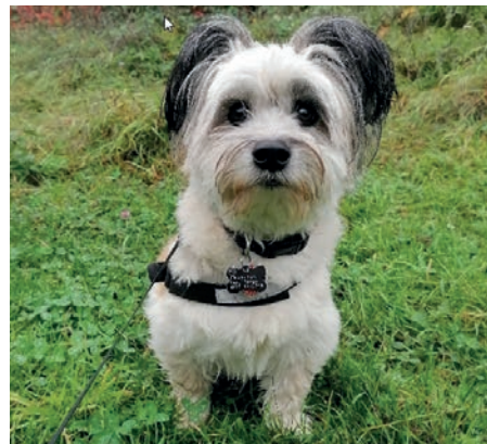
Weiß Frauchens Umtriebigkeit zu würdigen: Havanese-Mix Chuk