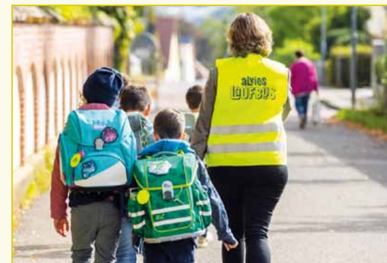
Frische Luft statt Elterntaxi