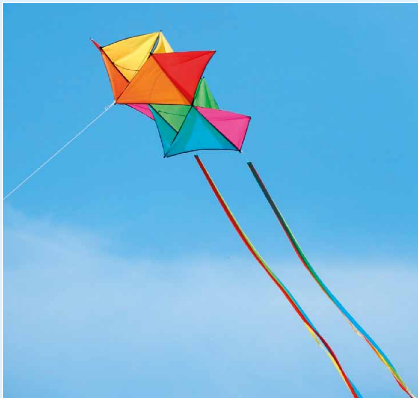
Endlich ganz oben: Drachen im Wind

Alljährlich zu Beginn des Herbstes informiert die Heilbronner Feuerwehr darüber, worauf beim Drachen steigen lassen unbedingt geachtet werden sollte. Da Drachen unabhängig von ihrer Form und Bauweise nicht nur als Kinderspielzeug gelten, sondern tatsächlich auch als Luftfahrzeuge, die überdies schnell an Höhe gewinnen können, sind einschlägige Luftverkehrsvorschriften auf sie anwendbar.