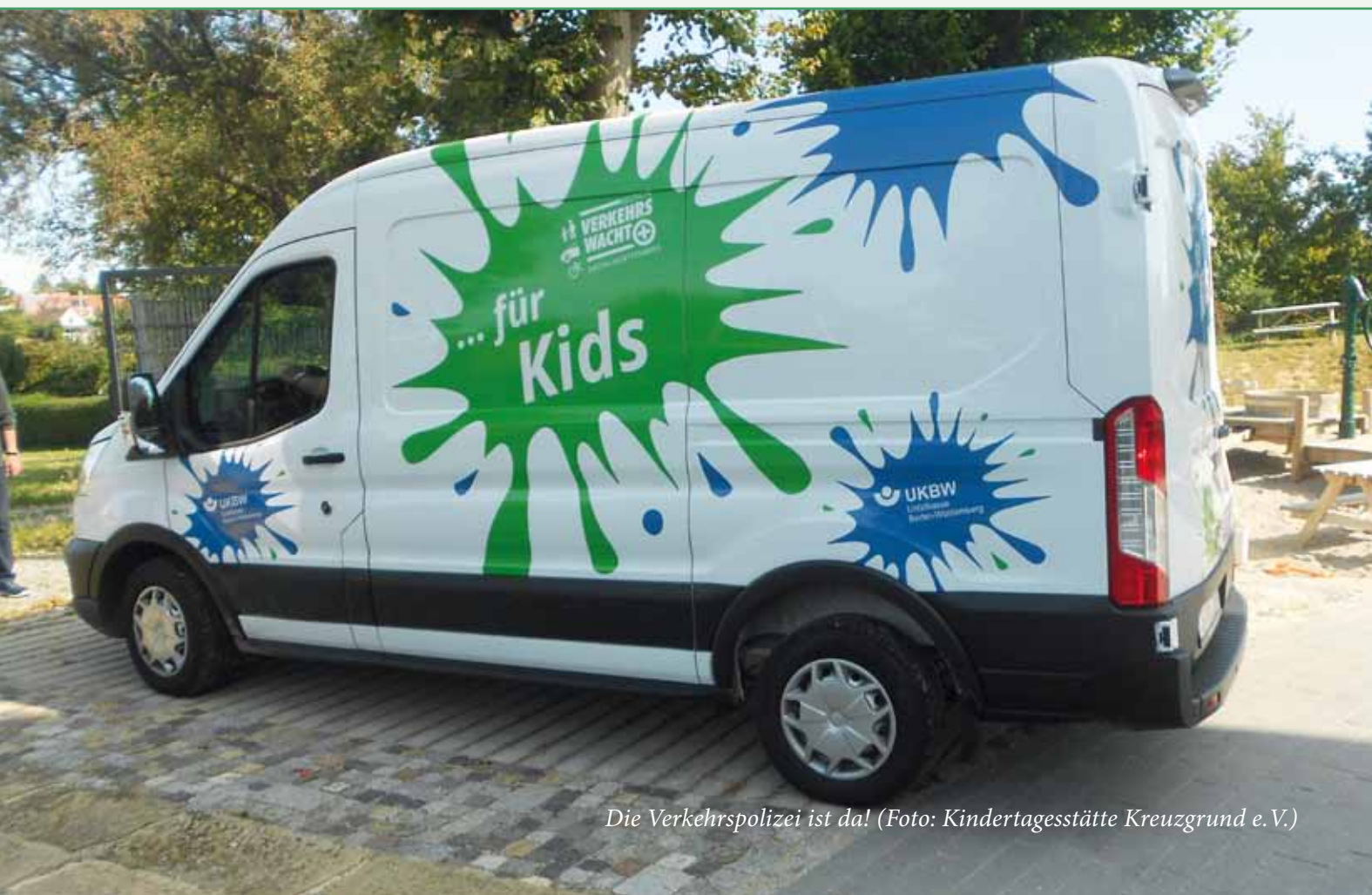
Die Verkehrspolizei ist da!