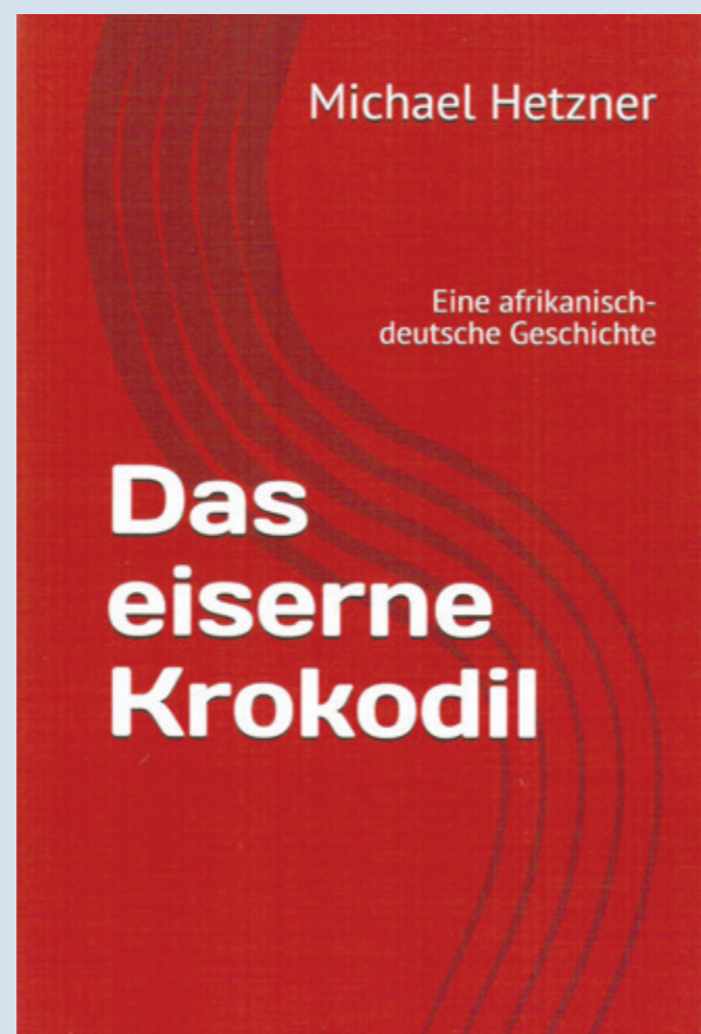
Der April-Buchtipps aus Böckingen

Was für ein Fortschritt. Obwohl unser Herrscher bereits vor Jahren alle Haushalte bis hin zur kleinsten Hütte großzügig mit Kabelfernsehen und Internet ausgestattet hatte, wiesen seine Sendungen nur eine magere Einschaltquote von 17,3 Prozent auf. Und nicht nur das, die Kritiker unseres Vaters