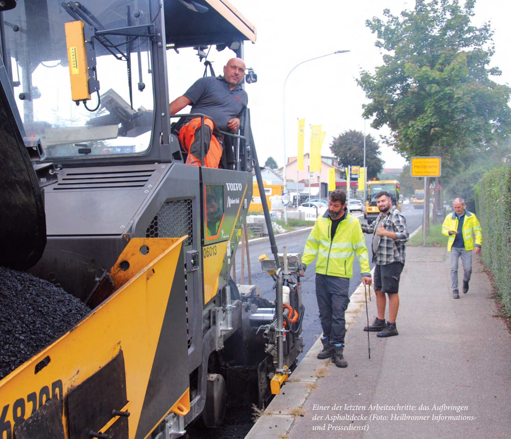
Einer der letzten Arbeitsschritte: das Aufbringen der Asphaltdecke