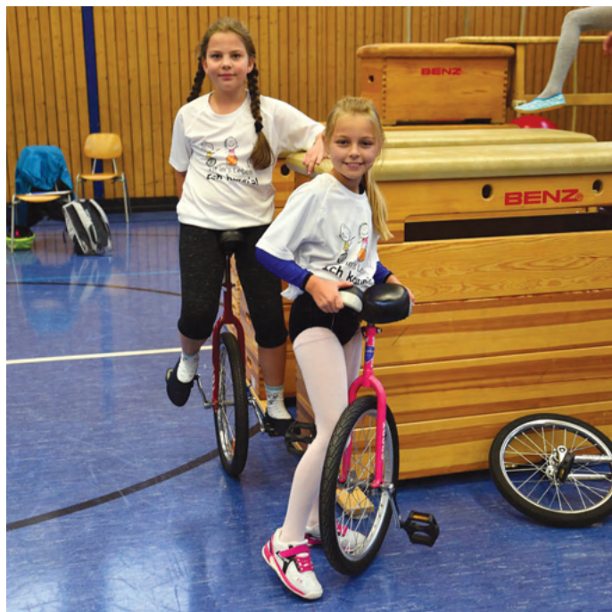
Die ersten Meter auf dem Einrad sind am schwersten

Weiterführende Informationen erhalten Sie online unter stiftung-fitinsleben.de