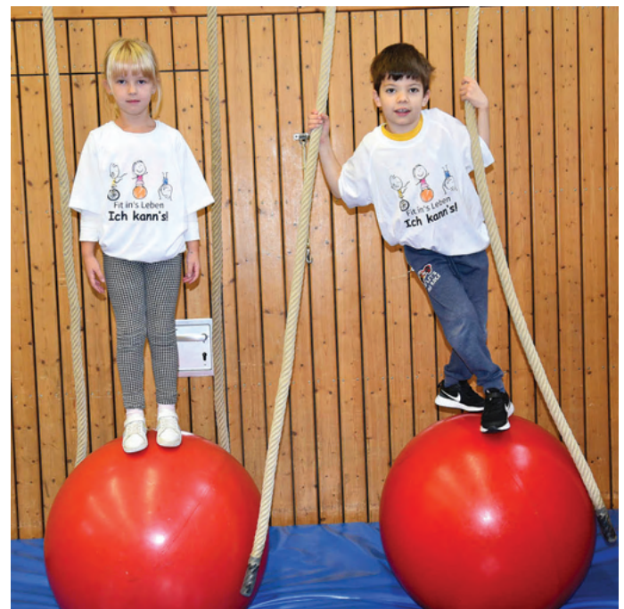
Auf die Balance kommt es an: Kinder in der Zirkus-AG an der Grünwaldschule