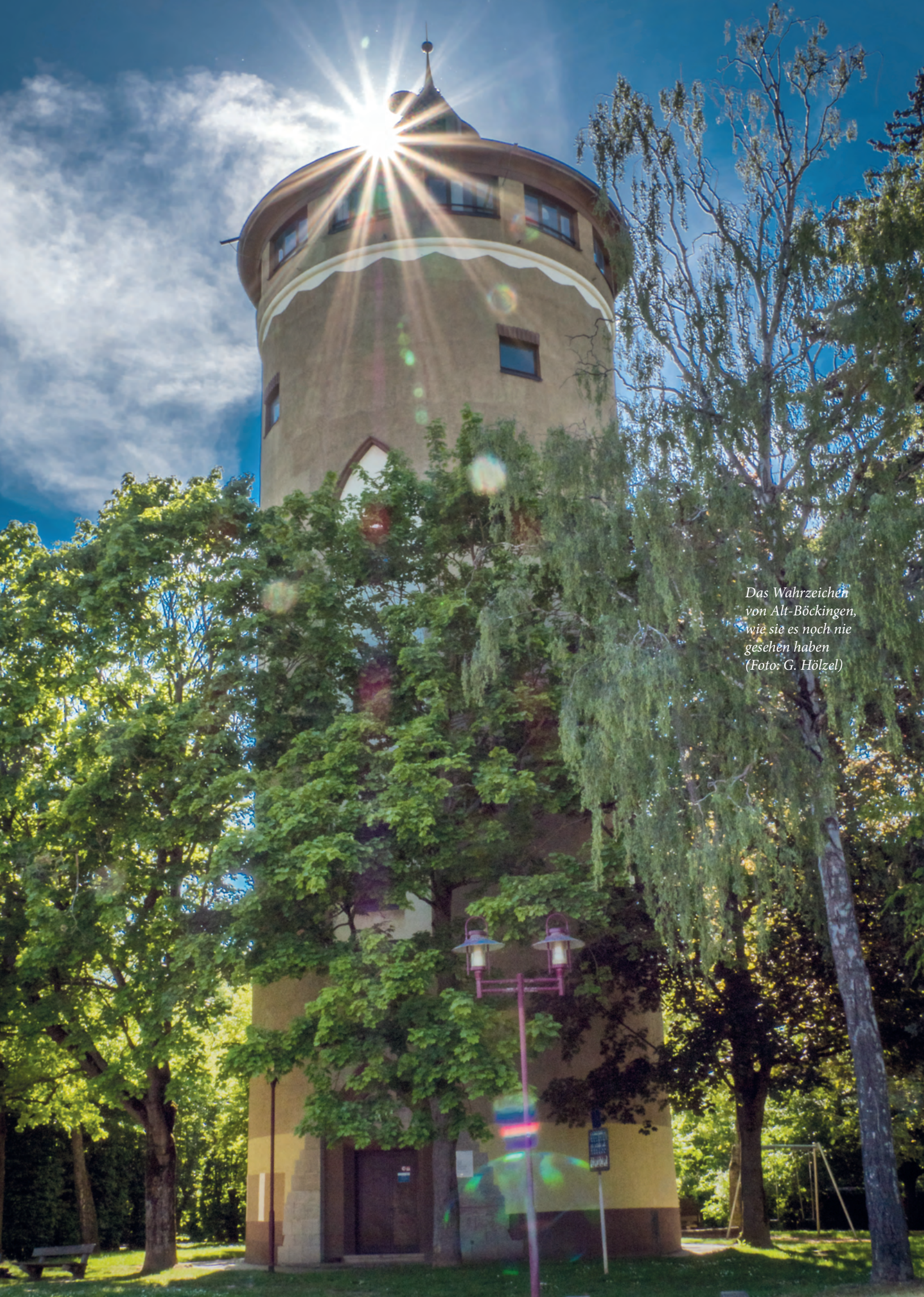
Das Wahrzeichen von Alt-Böckingen, wie sie es noch nie gesehen haben